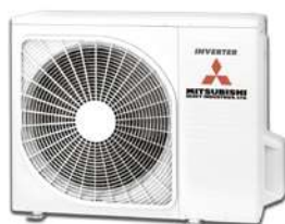
SRK20ZSPR-S SRK25ZSPR-S SRK35ZSPR-S SRK45ZSPR-S