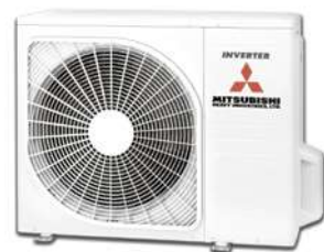
SRK63ZSPR-S SRK71ZSPR-S SRK80ZSPR-S